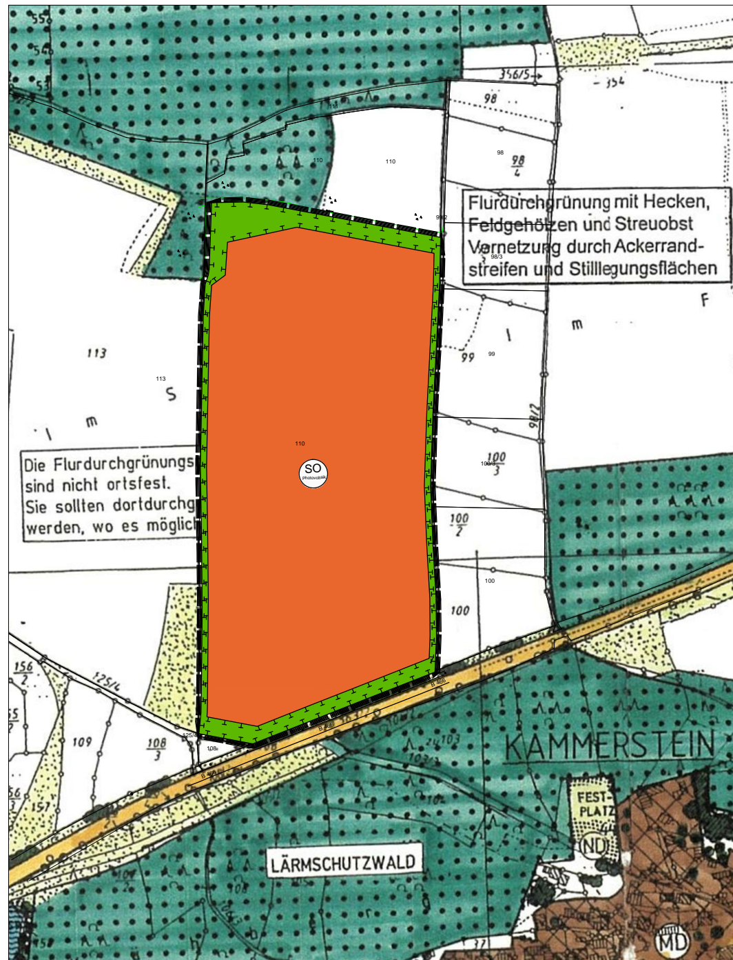
Flächennutzungsplanänderung Gemeinde Kammerstein