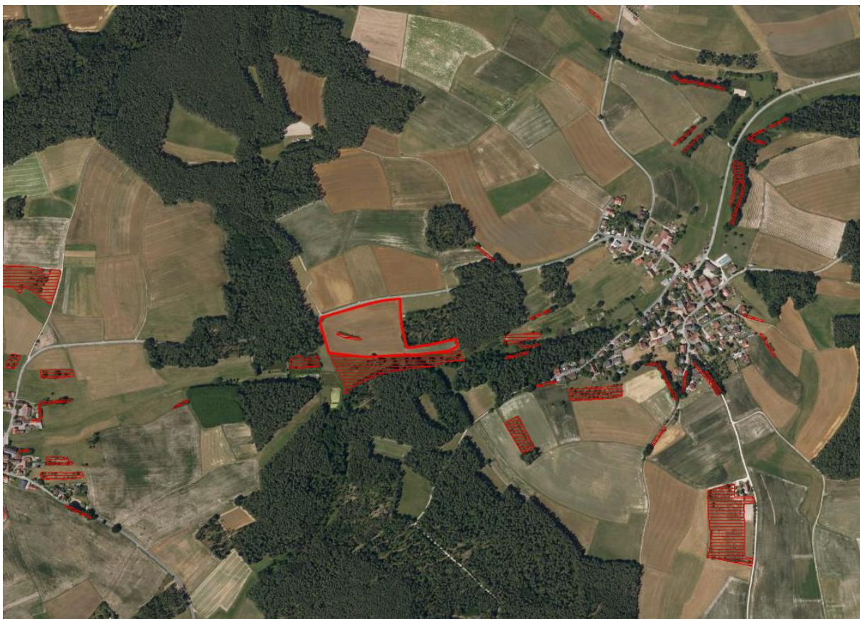
Abbildung 1 : Auszug aus Biotopkartierung

Es werden keine Flächen nach ABSP oder Biotopkartierung überplant. Das angrenzende kartierte und im Geltungsbereich liegende Biotop wird voraussichtlich nicht beeinträchtigt.