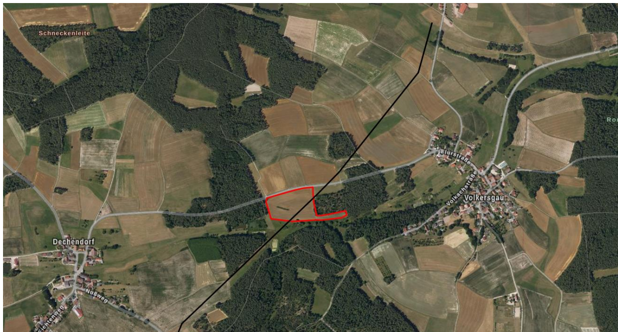
Landschaftsbild - rot umrandet: Geltungsbereich FNP-Änderung; schwarz: Freileitung

Blickbeziehungen von der Fläche aus in Richtung der Ortschaft Volkersgau bestehen aufgrund der Höhenabwicklung und der vorhandenen Waldflächen nicht.