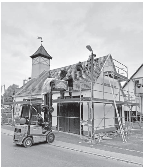
Im Oktober begannen die fleißigen Oberreichenbacher Feuerwehrleute mit den Renovierungsarbeiten des alten Feuerwehrhauses an der Volkach.