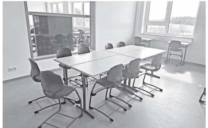
Ein Gruppenarbeitsraum zwischen zwei Klassenzimmern