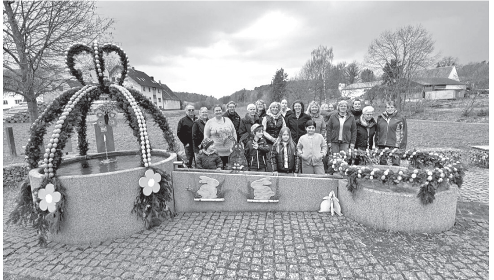
Darauf kann man schon stolz sein: Die Oberreichenbacher präsentieren ihren schönen neuen Osterbrunnen.