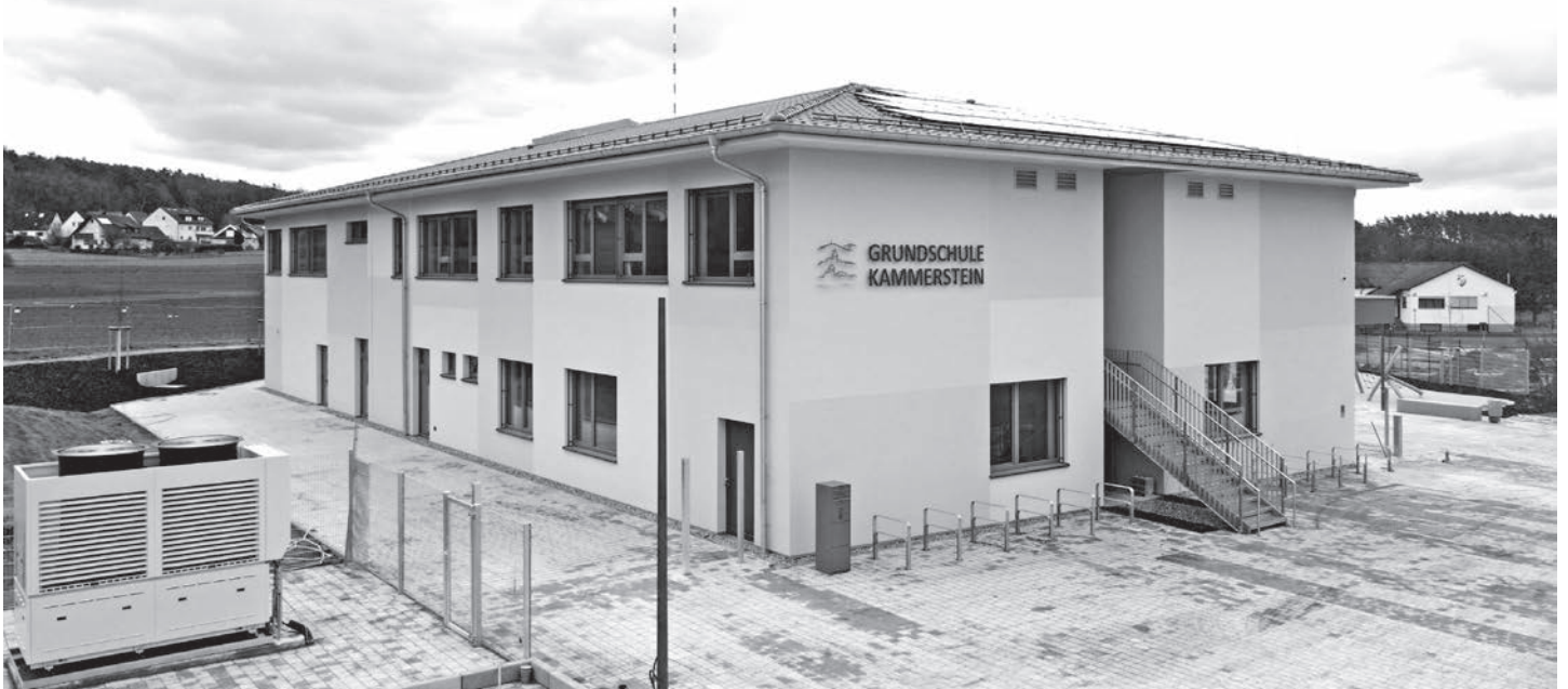
Drohen-Foto von unserer neuen Grundschule kurz vor der Fertigstellung.