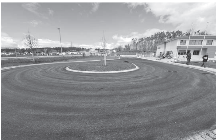
Die Bus-Wendeschleife wurde Anfang der Karwoche asphaltiert.