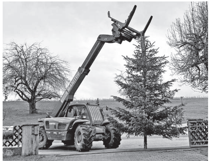
In Oberreichenbach wird nachhaltig gearbeitet: Ein Weihnachtsbaum wird als Bindegren für den Osterbrunnen genutzt.