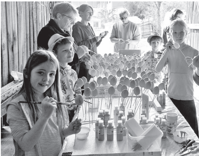
Mit großem Eifer bemalen Frauen und Kinder aus Oberreichenbach die 600 Eier und banden die Krone.