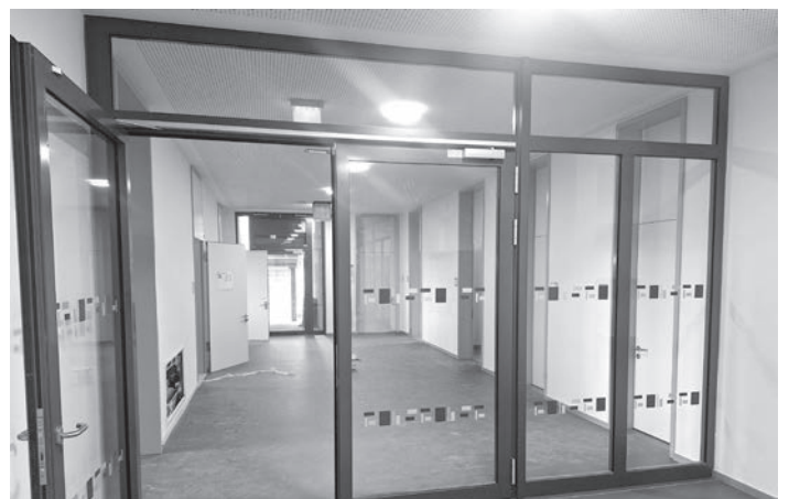
Modern und elegant: Der Zugang zum Bereich Lehrerzimmer / Rektorat.