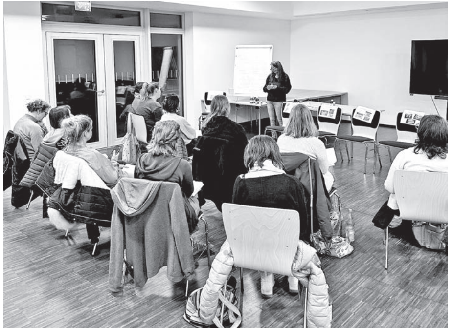
Die Volkshochschule bringt Menschen zusammen und vermittelt viele interessante Themen.

Eine Anmeldung lohnt sich – die Nachfrage ist groß!