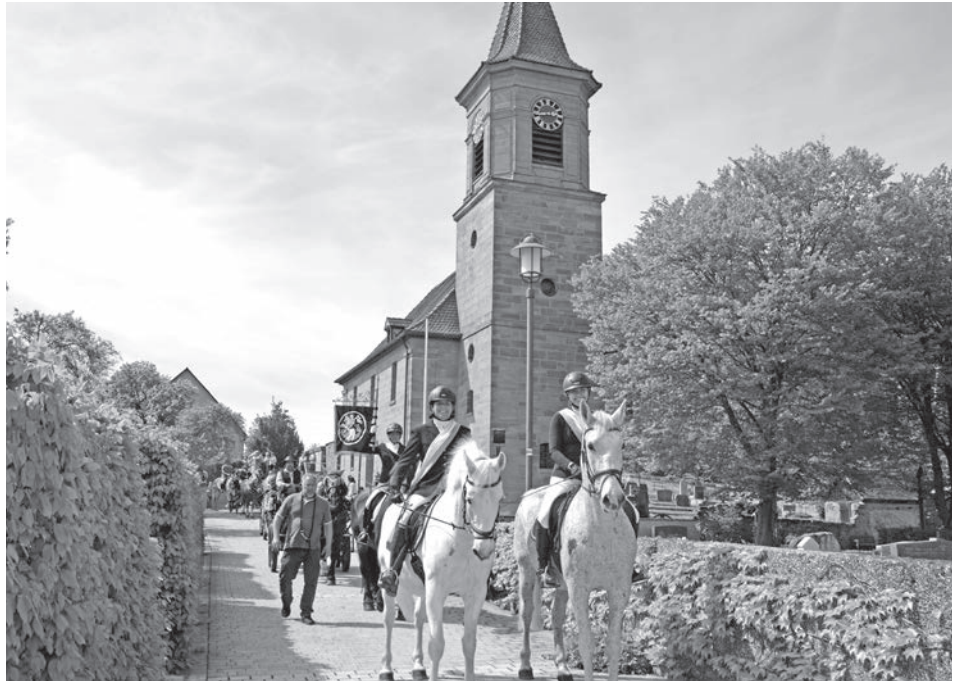
Der Georgi-Ritt in Kammerstein findet am 26. April 2026 statt.

Der Kammersteiner Georgi-Ritt wird von der Gemeinde Kammerstein, der Evangelischen Kirchengemeinde Kammerstein und