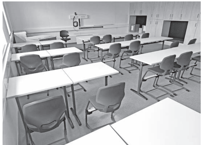
Eines der acht neuen Klassenzimmer. Das Galneo-Board fehlt noch.

terrichtsbeginn am 13. April nichts mehr im Wege stand.