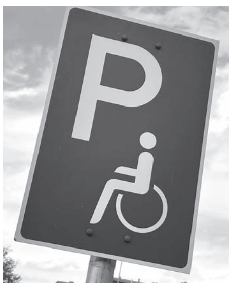
Die Erteilung von Behinderten-Parkausweisen unterliegt strengen Regelungen. So ist ein Merkzeichen „aG“ vom Zentrum für Familie und Soziales unabdingbar.

In diesem Fall ging es um die Ausstellung eines EU-einheitlichen Parkausweises