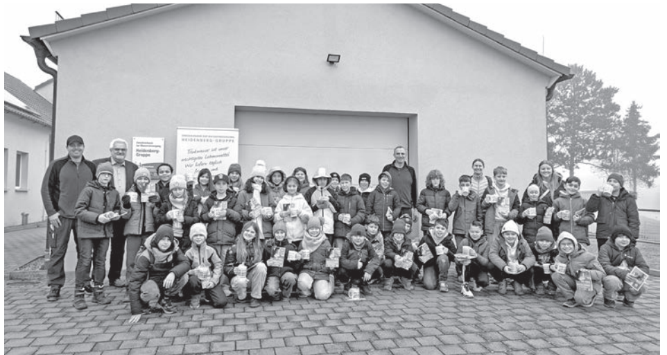
Gruppenbild nach der Führung: Die Klassen 4a und 4b der Grundschule Kammerstein haben das Wasserwerk Götzenreuth besucht

Besonders beeindruckt waren die Schülerinnen und Schüler von den großen Pumpen und technischen Anlagen, die sie aus nächster Nähe bestaunen durften. Im Anschluss konnten die Kinder ihr bereits im HSU-Unterricht erworbenes Wissen unter Beweis stellen: Bei einem Quiz rund um das Thema