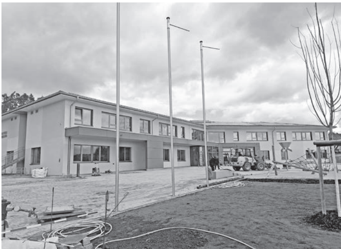
Schön ist sie geworden, unsere neue Grundschule, hell und freundlich.