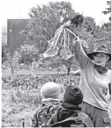
Die Schulkinder haben auf dem Bauernhof viel erlebt. Unter anderem lernten sie, wie gesundes Gemüse gezogen und zubereitet wird.