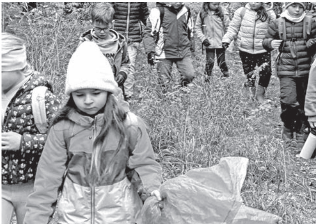
Auf der Wanderung nach Poppenreuth sammelten die Zweitklässler fleißig Müll im Rahmen der Schulaktion „Rama dama“.